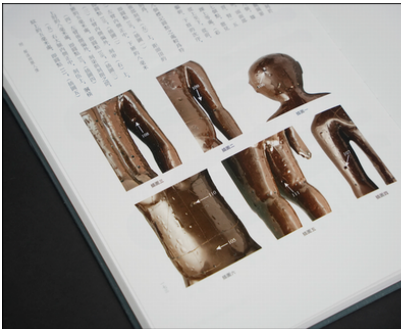
(左下) 「髹漆経脈人像」解説部分