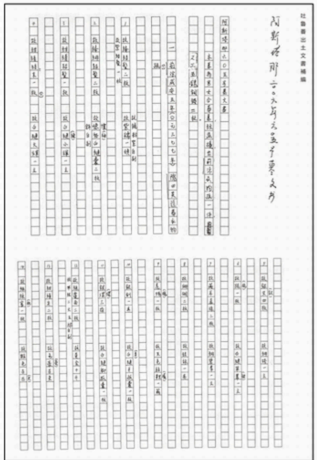
▲ カラー画像 + 釈文・注釈頁