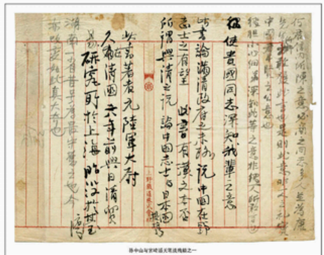
孫中山与宮崎滔天往来手迹之一