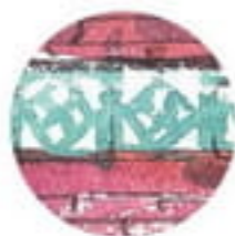
立面的女兒牆上，有幾何形狀裝飾的瓷磚。

出了東門市場，在四周閒逛，發現新竹的街道十分有趣，常常在一個轉角，冷不防地出現一棟令人瞠目結舌的美麗街屋，令人流連忘返。