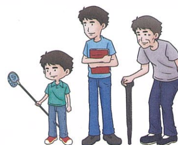
渐渐 长大 变老