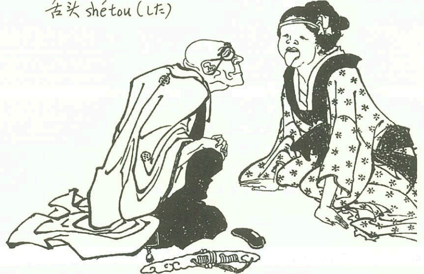
舌头 shé tou (した)

近朱者赤, Jìn zhū zhě chì, 近墨者黑。 jìn mò zhě hēi.