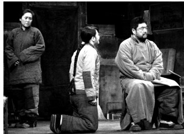
小福子：お父ちゃん……

二強嫂：(絶望して) あんたは大馬鹿者の人殺しだ！ この子はもうおしまいだ。私も殺してくれ。(死に物狂いで二強子にむしゃぶりつく)