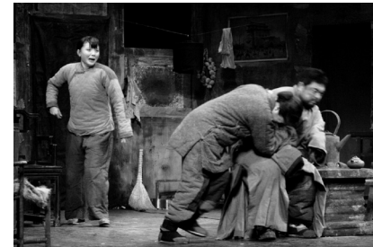
二強嫂：私も殺してくれ