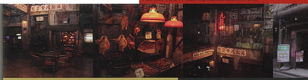
九龍城寨風格的遊樂場「WAREHOUSE川崎店」

凡是講究極致的日本研究精神，不只畫下了九龍城寨的詳盡地圖，更在日本神奈川縣川崎市內由遊戲機公司完整一復刻一城寨樣貌，作為主題樂園，營造出混亂無序、老舊汗穢的空間，相當考究細節的日本團隊找來裝置藝術家Juzo Hoshino，從招牌、斑駁的牆壁，到還原居民職業，雖然是大型主題電子遊樂場，但精緻的場景還是讓許多香港人飛到川崎重新認識香港已不復見的九龍城寨。 像是一場禁忌的探索，越是黑暗越讓人好奇，關於人性與社會化的真相，絲毫不會隨著九龍城寨的磨平而消逝。或許就像很多港人所說，如果沒有日本在最後一刻抓住城寨模樣，這座城市的記憶，終究成為一個都市傳說。