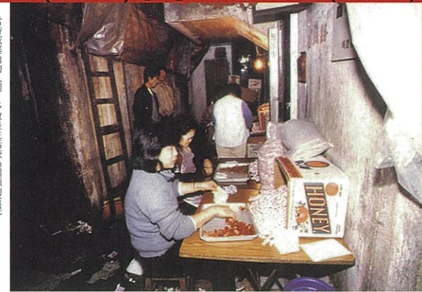
當時城寨內的人們，多數是生活較為困頓的貧民，混雜的生活環境記載了香港社會文化。