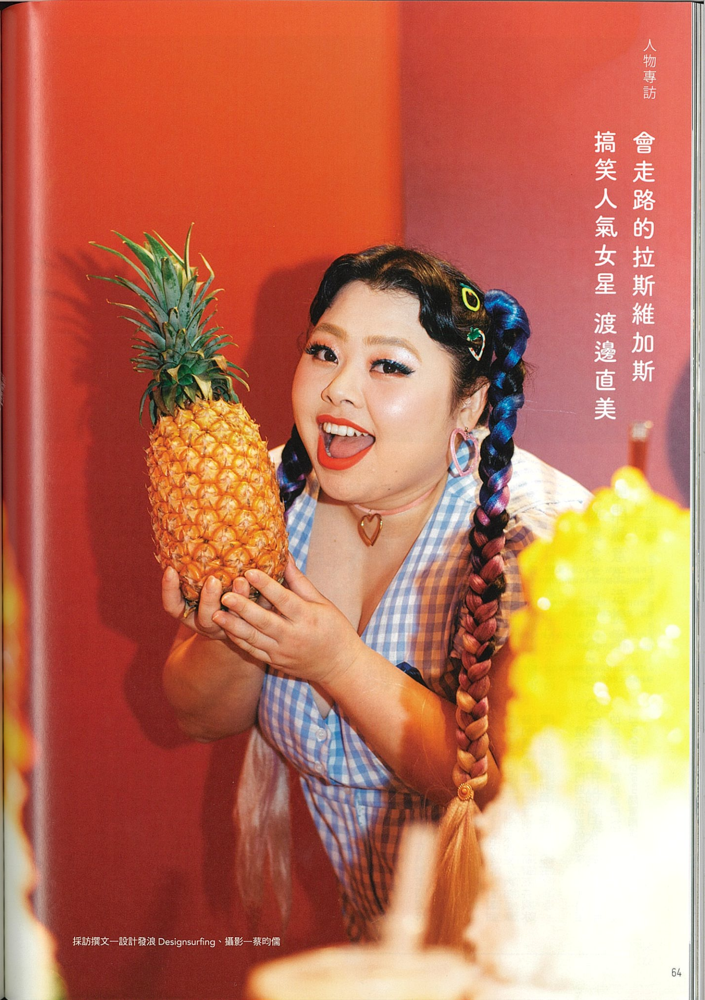
採訪撰文—設計發浪 Designsurfing、攝影—蔡昀儒