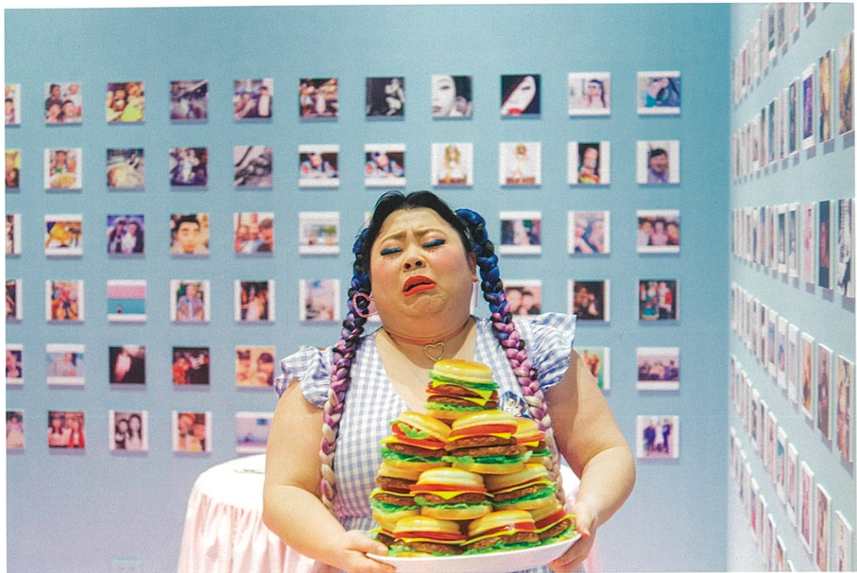
渾身是戲的渡邊直美在個人臺灣首展上展現最真實的一面。