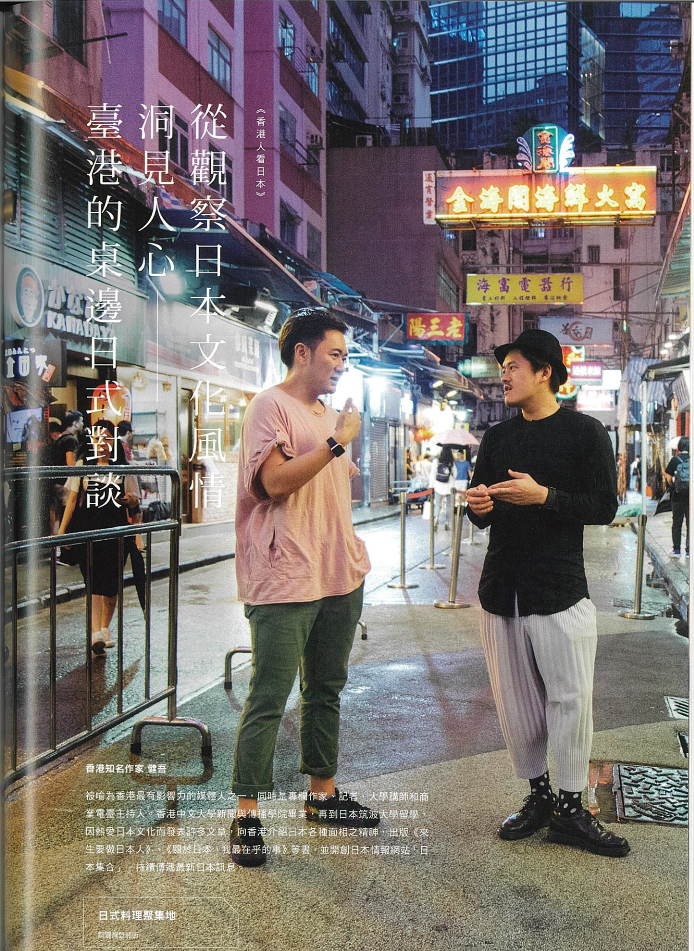
香港知名作家 健吾

被喻為香港最有影響力的媒體人之一，同時是專欄作家、記者、大學講師和商業電臺主持人。香港中文大學新聞與傳播學院畢業，再到日本筑波大學留學，因熱愛日本文化而發表許多文章，向香港介紹日本各種面相之精神，出版《來生要做日本人》、《關於日本，我最在乎的事》等書，並開創日本情報網站「日本集合」，持續傳遞最新日本訊息。