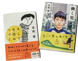
最近熱愛的日文書籍是演藝、藝文雙棲的星野源作品。

網路傳媒經常追求點擊率數字，舉世皆然，但對健吾來說，如果做媒體僅是譁眾取寵，那不如不做。因此他經營網站有一套自己的模式。「香港閱聽者喜愛的文化都很表層，因此我在規劃網站內容時，為了要維持住網站流量，還是會做 6、7 成大眾普遍有興趣的日本主題，其他 3、4 成就是比較有觀點與深度的文章。我有個同事專門寫些沒什麼人要看的内容，我也會轉發你有關日本設計的評論與介紹，因為香港幾乎沒有人可以寫這樣的東西，但一個資訊網站沒有這些精關的內容，做了還有什麼意義呢？」健吾說得深刻，對此情形也莫可奈何。