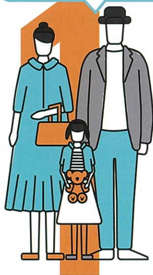
一家三口的日本家庭

職業 金融業 年齡 父親(42) 母親(38) 女兒(5) 居住地 香港 港島東側太古城