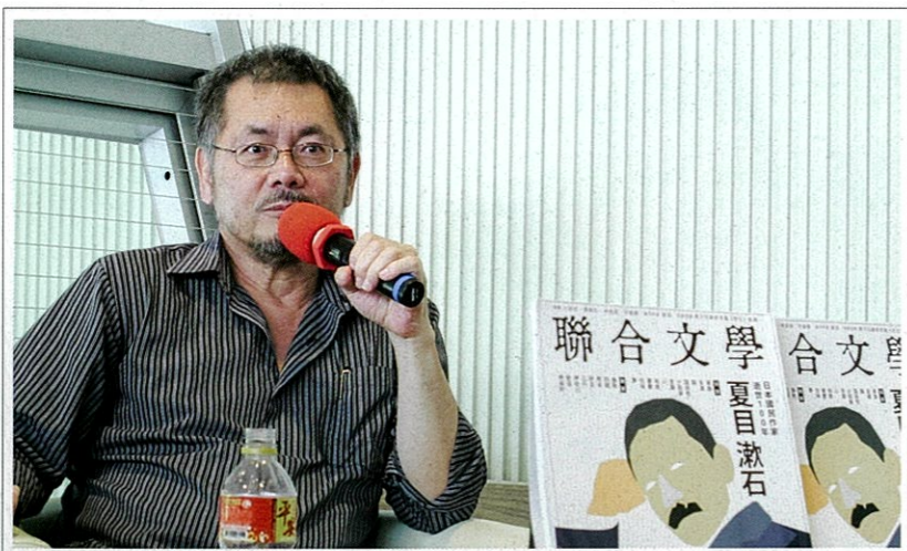
在台灣有飲食文學教父及舌尖上的詩人之稱的焦桐，在《味道福爾摩莎》書中深刻挖掘這島嶼上不同年代人的共同記憶，透過味覺記憶的書寫傳遞，每一段都回味無窮。