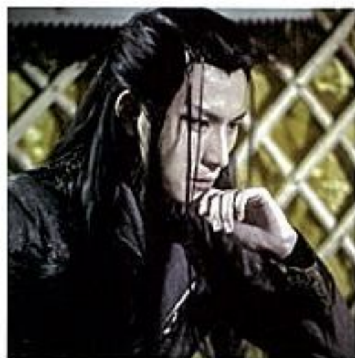
十三 国内顶尖 COSER、动漫创意摄影师 代表作:《仙剑奇侠传4》《天下2》《最终幻想7》